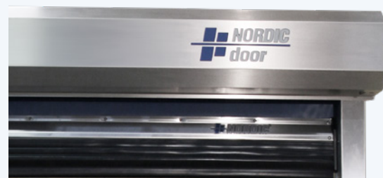
Rostfri bottenprofil med flexibel gummilist som tätar mot golv.